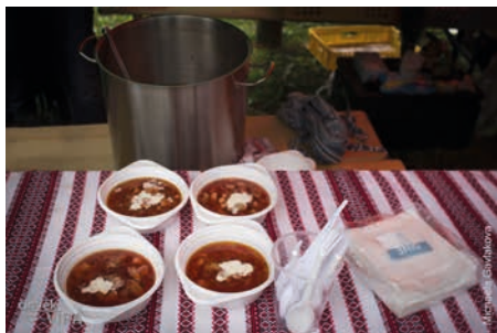
Boršč na Ukrajinském festivalu

Festivalem budou znít originální melodie a stejně jako loni můžete zdarma ochutnat boršč, připravený z autentických surovin z rukou šikovných ukrajinských kuchařek. Atmosféru doplní výstava fotografií a nudit se nebudou ani nejmenší návštěvníci, pro ně jsme si připravili doprovodné workshopy. Vlastnoručně