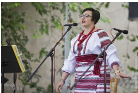
Ukrajinský vokální soubor Korále