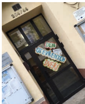
Nízkoprah Horizont otevřel prostory klubu veřejnosti

Občerstvení, které připravily pracovnice ze sociálního podniku Melivita s. r. o., bylo výborné a rychle zmizelo. Na den otevřených dveří zavítalo navíc několik zástupců z vedení městského obvodu Slezská Ostrava, včetně pana starosty a nás moc těší zájem, který o podporovanou službu mají. Bez jejich podpory bychom neměli vhodné prostory pro práci v této lokalitě. Zajímali se o to, co nabízíme a jak pracujeme s místními dětmi