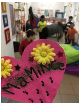
Dárek pro maminku, foto: Archiv DCHOO