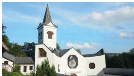
Mariahilf, foto: Archiv Ch. Jeseník

Stejně jako tenkrát, i dnes je spojováno toto místo s ochranou nenarozeného života. V kostele se pravidelně modlí k Matce Boží za ochranu rodin, nenarozených dětí a sblížení národů.