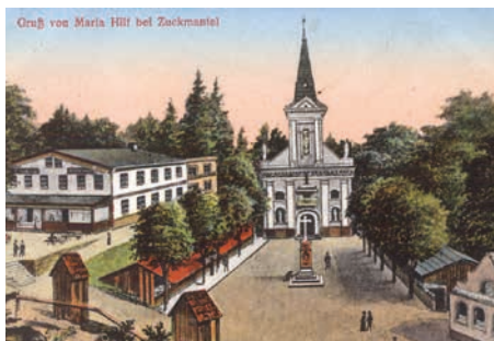
Historický snímek poutního místa

První červnovou středu se setkají pracovníci Charit ostravsko-opavské diecéze spolu s příznivci charitního díla v poutním kostele Panny Marie Pomocné u Zlatých Hor. 5. června zde oslaví tradiční Diecézní pouť Charit. Letos doputovala organizátorská štafeta do Charity Jeseník, i proto jim patří pár následujících řádků, ve kterých se Vám představí.