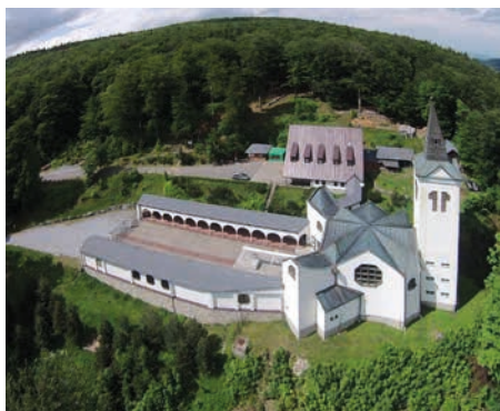
Mariahilf z výšky