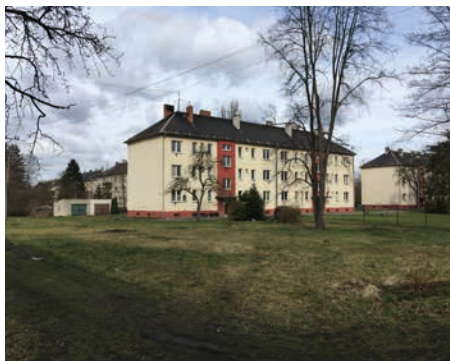
Lokalita Ostrava-Kunčičky, kde charitní služby působí

Co je denním chlebem sociálního pracovníka? O co tato profese usiluje a co je hnacím motorem těch, kteří se jí věnují? A proč vytrvat navzdory nízkému společenskému statusu?