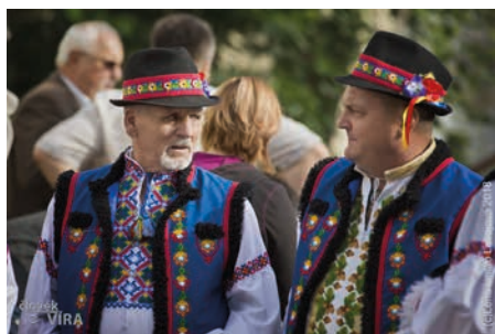
Tjačivská muzika