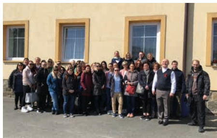
Tým Diecézní charity ostravsko-opavské na duchovní obnově v Odrách

Závěrem bychom rádi poděkovali těm, kteří nám během duchovní obnovy věnovali svůj čas. Všem charitákům pak přejeme slovy otce Pavla Obra, který se jako školní kaplan věnuje studentům SŠ sv. Anežky: „Ať v sobě cítíte vnitřní radost a pozitivní zpětnou vazbu nejen od svých klientů.“ sl