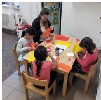
Děti vyráběly přání pro maminky, foto: Archiv DCHOO