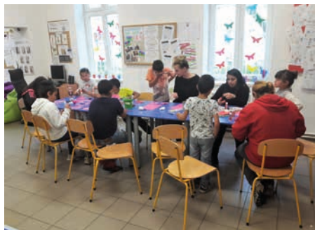
Workshop pro děti během dne otevřených dveří

„Odnesu to mamince hned, protože se nemůžu dočkat, jakou bude mít radost,“ rychle prohodila Lucinka a odběhla. Za chvíli se vrátila a celá zářila, jak byla maminka překvapená a jakou měla radost, i když se nemohla sama přijít podívat, kde Lucka tráví volný čas. Bylo