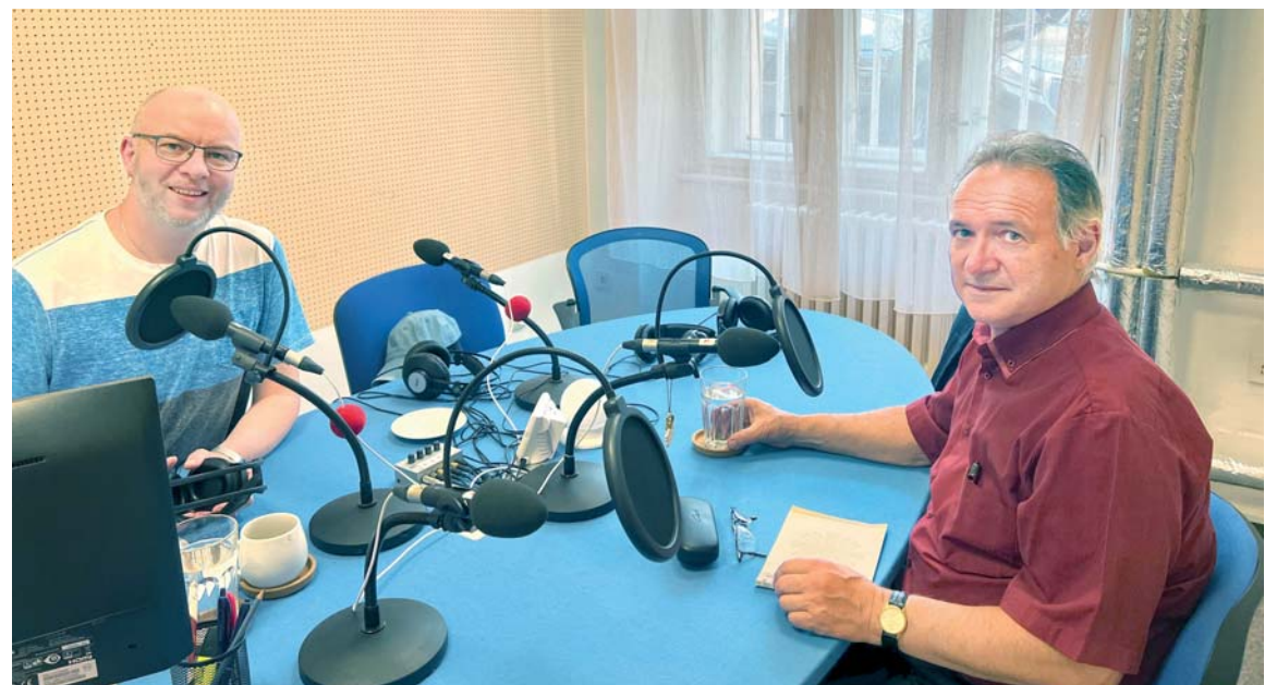
Z natáčení charitního podcastu Charitalk.