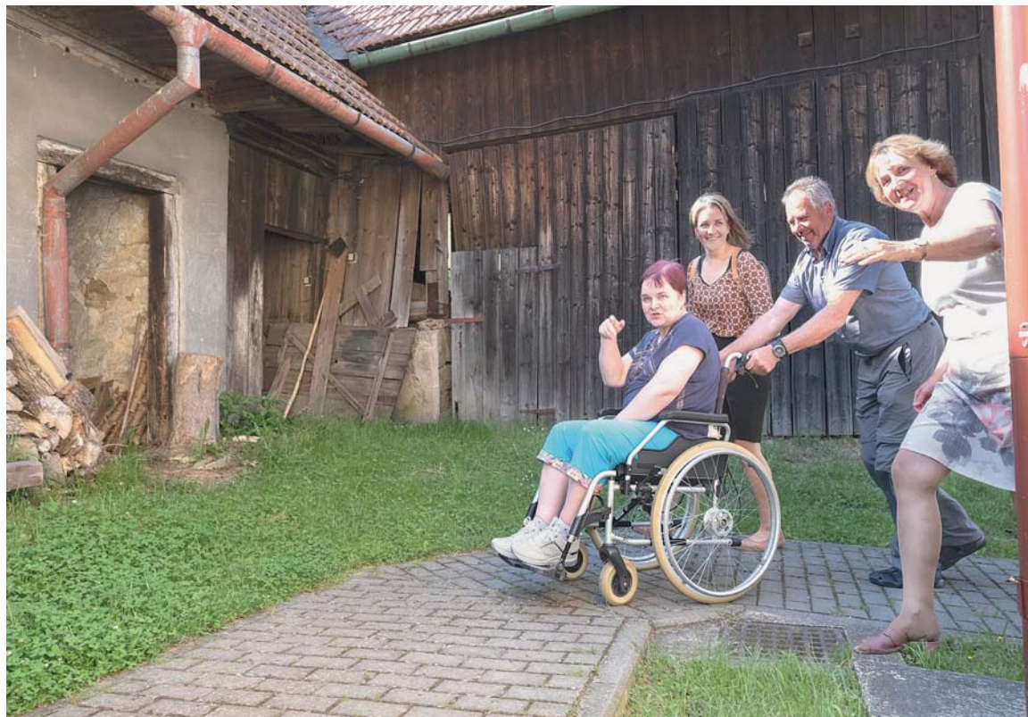
Práce v Charitě není jako každá jiná...