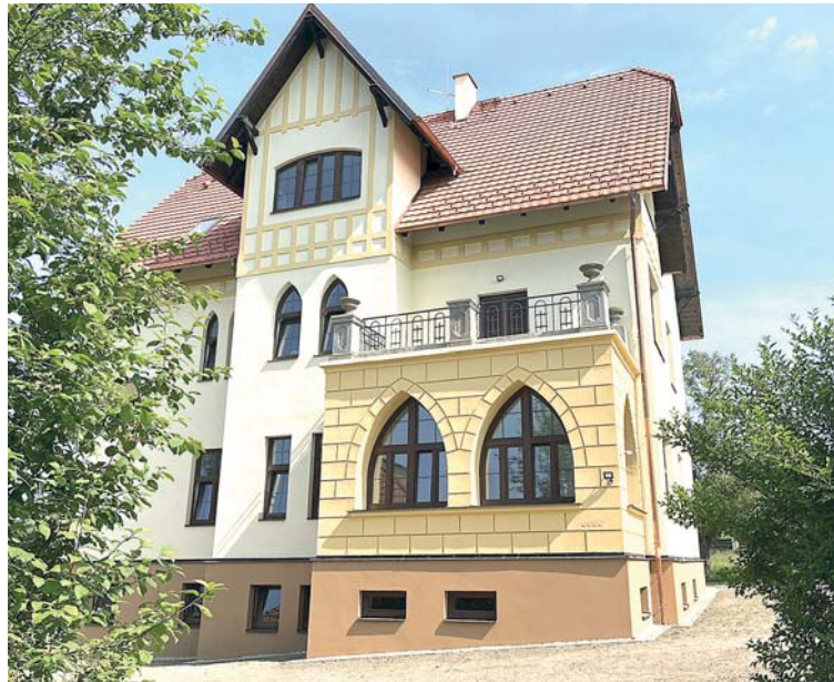
Českobudějovický dům, kde se léčí šrámy na duši.

Místo her a radosti jsou svědky násilí a rozpadu rodiny. Traumata si od dětství nesou i do dospělého života: mají problém důvěřovat okolí i sami sobě, nevědí, jak vybudovat zdravý vztah. Šrámy na duši nejsou vidět, ale na celý další život dětí mají obvykle významnější dopad než viditelný zdravotní handicap.