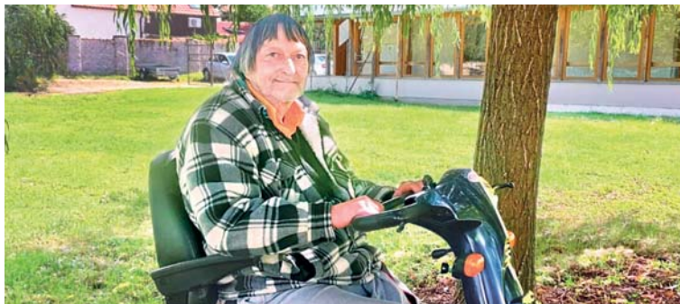
Centrum pro tělesně postižené Fatima vrací do života.

Vážná nemoc nebo úraz obrátí člověku život vzhůru nohama. Šedesátiletému Petrovi kvůli bércovému vředu amputovali nohu. Teď si zvyká na život s invalidním vozíkem.